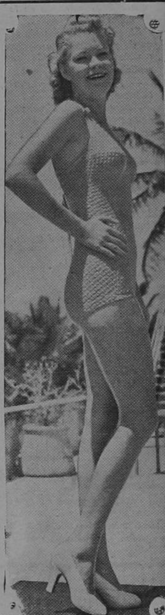
Al ver este pión, hasta los viejitos se ponen juguetones...